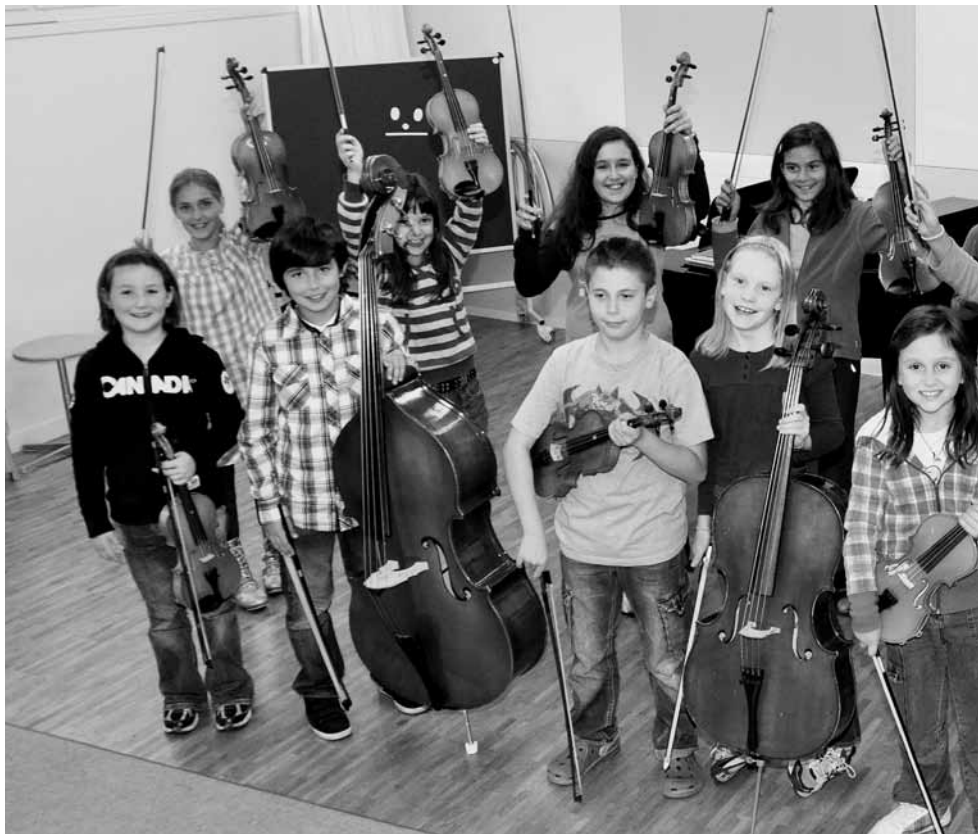
Die jungen Streicherinnen und Streicher der «miniStrings» proben wöchentlich zusammen.