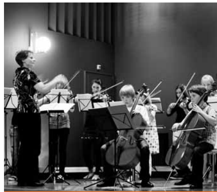
Auch Auftritte gehören zum Jahresprogramm.

der Kinder, Jugendlichen und Erwachsenen aus.